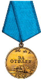
Медаль «За отвагу» (03.02.1945)

в РККА с 09.1940 года Место призыва: Наровчатский РВК, Пензенская обл., Наровчатский р-н